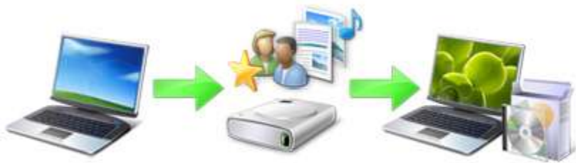
Upgrade von Windows XP auf Windows 7 im Überblick