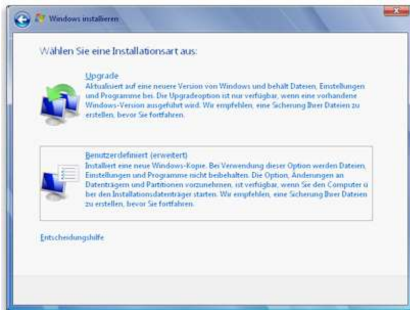
Optionen für die Installation von Windows 7

Wenn Sie sich bei der Installation für die Option "Benutzerdefiniert" entschieden haben, installieren Sie eine neue Kopie von Windows auf Ihrem PC.